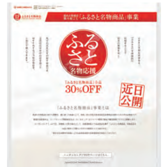
特設コーナーのイメージ

方創生を目的とした「地域住民生活等緊急支援交付金」（政府の平成26年度補正予算）を活用して、各自治体で取り組まれており、その効果に期待が集まっています。ニッポンセレクト.comでは、これを活用した域外型消費喚