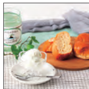
ブカブカ エキストラバージョン ココナッツオイル

SEO対策がしっかりしており、検索するといつもニッポンセレクト.comが上位に出てくる。自社ECと同じくらい売上があるので助かっている。現在、注文殺到で商品の欠品が続くお客様に迷惑をおかけしているが、このサイトに出品できてよかったと思っている。