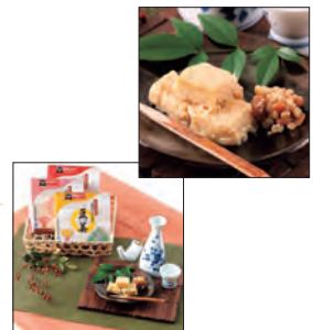
豆美 (とうひ) 4個入りギフトセット

画像の出来栄えに大満足。従業員皆からも歓声が上がった程だった。さらに、画像のデータもいただけたので、早速自社カタログに使用する予定。お恥ずかしながら、パソコンに疎い私どもでも、ファックスでのやりとりで対応していただき、感謝している。