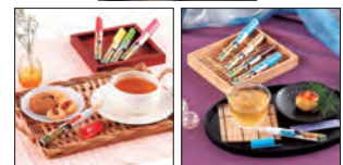
緑茶、ウーロン茶、紅茶等